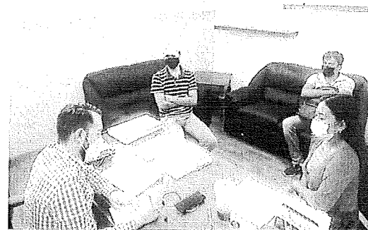
Atención a integrantes de Antorchistas por el tema: Albergue de Felipe Carrillo Puerto 18-may-22

A 16 asociaciones civiles , se les atendió de manera digital y telefónica, a quienes se le asesoró respecto al estímulo fiscal.