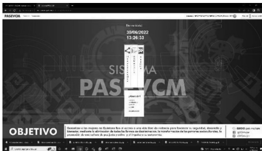
15/05/2022 Evidencia de registro de actividades en el sistema informático SIPASEVCM.