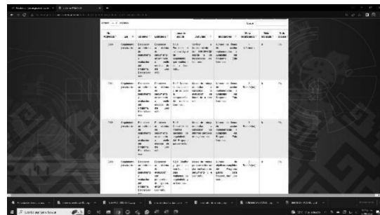
15/05/2022 Evidencia de registro de actividades en el sistema informático SIPASEVCM.