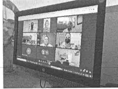
16/02/2022 Sesión PASEVCM.

Se ha participado en las comisiones del sistema para prevenir, atender, sancionar y erradicar la violencia contra las mujeres, asimismo, actualmente se alimenta el Sistema Informático del PASE, por parte de la DIGAVIG, además de acordar internamente el seguimiento por parte de la dirección de las acciones que como SEGOB se realicen, también se revisa el sistema de manera periódica con el fin de verificar los avances reportados.