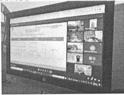
16/02/2022 Sesión PASEVCM.

SEGOB DIGAVIG SECRETARÍA DE GOBIERNO DIRECCIÓN GENERAL DE ATENCIÓN A LA VIOLENCIA DE GÉNERO