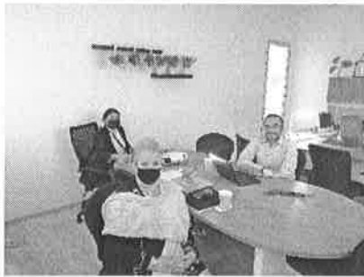
23/03/2022 Reunión institucional de seguimiento de PASEVM.

Se participa en el Sistema PASEVM en calidad de invitado, en el cual como dirección general se expone sobre los avances en el mecanismo de Alerta de Violencia de Género contra las Mujeres, asimismo, se apoya como parte de la Secretaría de Gobierno en la comisión de evaluación y seguimiento, también se participa en las comisiones de prevención, erradicación y atención del sistema antes mencionado.