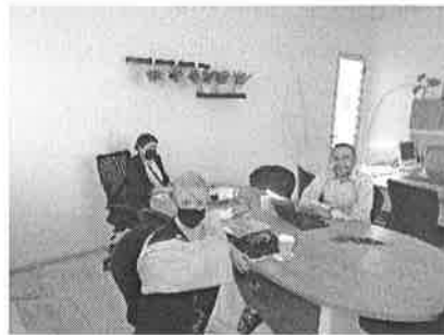
23/03/2022 Reunión institucional de seguimiento de PASEVM.