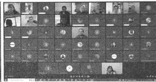
20/11/2022 Cuarta Sesión Extraordinaria del Sistema Estatal PASEVCM. Con motivo de implementar estrategias de coordinación de la Sistema Estatal PASEVCM y de la AVGM, la DIGAVIG.

Como resultado se informa ante el sistema la intervención que la dirección general tendrá en el marco de actuación del programa integrando una metodología que se expondrá ante las comisiones, con lo cual se cimentarán las bases metodológicas para su seguimiento posterior.