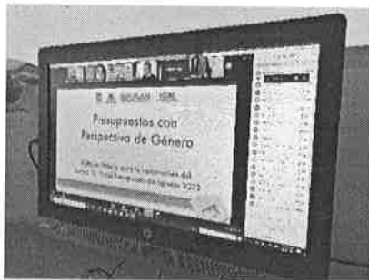
03/02/2021 Reunión con dependencias y OSCs para presupuestos con perspectiva de género.

Se participo en las reuniones con colectivas relacionado con presupuestos con equidad de género, en los cuales se realizó una propuesta por parte de las dependencias responsables del presupuesto, asimismo se ha realizado la participación de los ayuntamientos para la aportación de información entorno a los costos por realización de las actividades incluidas dentro del mecanismo de Alerta de Violencia de Género contra las Mujeres.