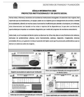
25/05/2022 Evidencia de presentación de proyecto presentado ante SEIPLAN para su financiamiento.