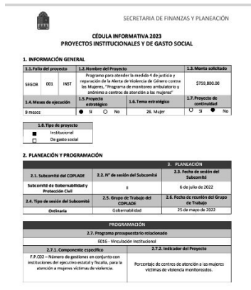
25/05/2022 Evidencia de presentación de proyecto presentado ante SEIPLAN para su financiamiento.

En este trimestre en coordinación con el IQM y la SEFIPLAN, se ha impulsado el cumplimiento de los indicadores plasmados en el Programa PASEVCM, lo que ha determinado el ejercicio de acciones por las instancias para contemplar presupuestos con perspectiva de equidad de género.