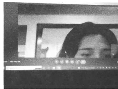
08/11/2022 Reunión para actualización del SIPPRES el de la Dirección General.