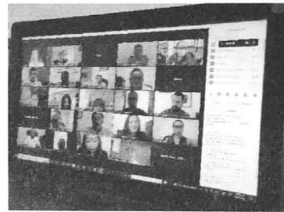
06/09/2022 Participación en el subcomité de gobernabilidad para indicar avance de actividades programadas.