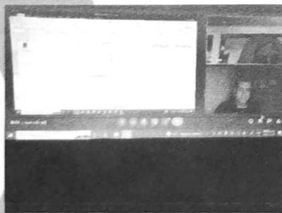
08/11/2022 Reunión para actualización del SIPPRES el de la Dirección General.