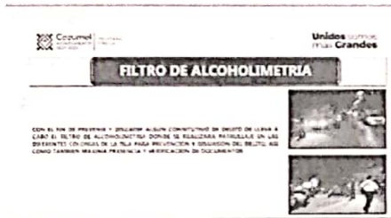
22/06/2022 Evidencia de verificación por parte de autoridades municipales operativos preventivos.

Con las dependencias estatales y ayuntamientos, se han mantenido reuniones para verificar los avances en la atención de las medidas de la Alerta de Violencia de Género Contra las Mujeres, en estas se han reportado acciones en torno a la prevención, indicando mecanismos para atender las mismas y la estadística de los trabajos.