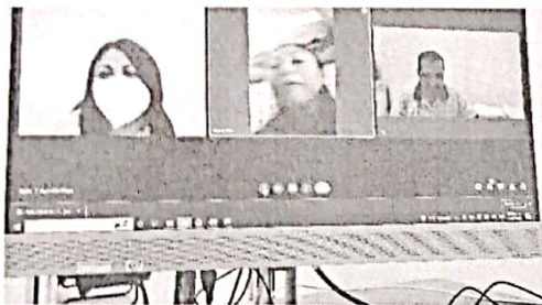
14/07/2022 Capacitación enlaces del municipio de Solidaridad.

Se realiza la verificación de la evidencia proporcionada por ayuntamientos respecto a las acciones de supervisión en de establecimiento de venta de bebidas alcohólicas como parte de los patrullajes preventivos, asimismo se capacita a las personas pertenecientes a corporativos policiales que actúen como primeros respondientes.