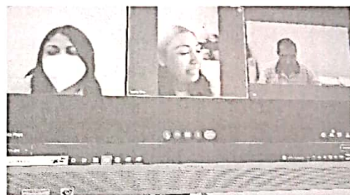
14/07/2022 Capacitación enlaces del municipio de Solidaridad.