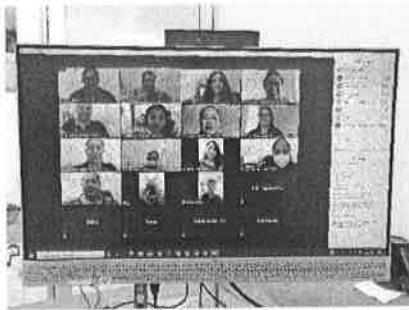
26/01/2021 Reunión con enlaces municipales para tratar temas de capacitaciones.

Dentro de los temas tratados en la capacitación a personal de los ayuntamientos se mencionó el tema de las capacitaciones dirigidas a mujeres, sobre todo en zonas de alta vulnerabilidad, sin embargo, por el tema de la pandemia, indican que pueden realizar dichas capacitaciones por medio de los centros de atención, pero a distancia, motivo por el cual esta actividad la realizan de manera virtual, asimismo informan sobre las atenciones brindadas en dichos centros.