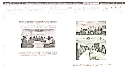
Ejemplo de informe de capacitación del municipio de Othón P. Blanco

Con la generación de informes periódicos se evidencia la atención adecuada de las acciones para atender la Alerta de violencia de género, es importante mencionar que estos informes se generan con una metodología para presentarlos.