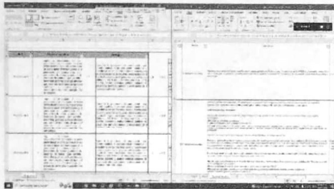
12/2022 Verificación de concurrencias entre mecanismos de prevención, atención, sanción y erradicación SIPASEVCM y AVGM

Se realiza un análisis de las acciones incluidas en el Sistema PASEVCM y de la AVGM para generar una vinculación de las líneas de acción y de las medidas de los instrumentos para encontrar las coincidencias entre los mismos, lo anterior para sintetizar los marcos de actuación, además se presenta ante el pleno del PASEVCM la estrategia de vinculación de los mecanismos.