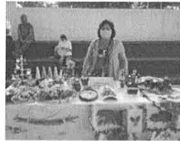
01/2022 Evidencia de capacitación del municipio de Cozumel.