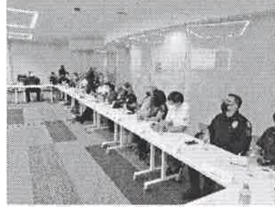
18/08/2021 Reunión con los GEAVIG.

En la reunión con los GEAVIG, se indica la importancia de realizar patrullajes preventivos en zonas con mayores índices de violencia, con lo cual se verifica el cumplimiento de los horarios de venta de bebidas alcohólicas, asimismo se expone las acciones necesarias para el cumplimiento de las medidas incluidas en la AVGM, teniendo como titularidad a la SSP estatal.