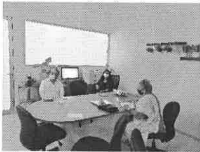
27/08/2021 Reunión con titular de la Fiscalía General de Estado para implementar estrategias de atención de la AVGM.

Con las dependencias estatales, se han mantenido reuniones para verificar los avances en la atención de las medidas de la Alerta de Violencia de Género Contra las Mujeres, en estas se han reportado acciones en torno a la prevención, indicando mecanismos para atender las mismas y la estadística de los trabajos.