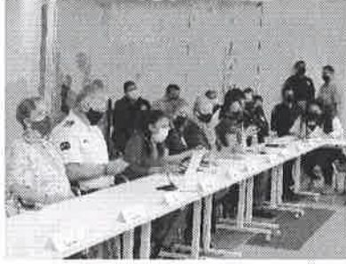
18/08/2021 Reunión con los GEAVIG.