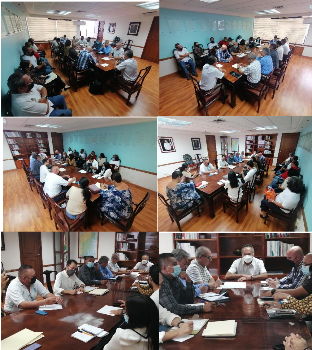
30 de mayo 2022 se realiza reunión de seguimiento para a atención a las demandas salariales y pago de prestaciones para personal de confianza y directivos de COBAQROO.