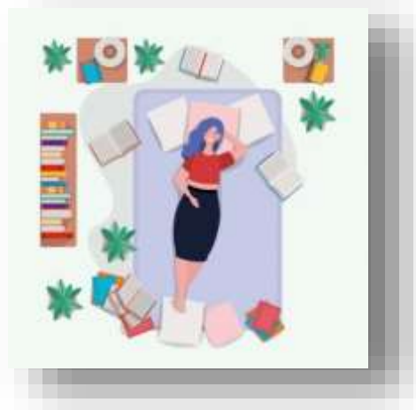
Ilustración 2 Relajación muscular progresiva

La relajación muscular progresiva se alcanza tensando y relajando un grupo de músculos repetidamente hasta que el músculo permanece relajado. A medida que se practica, se aprende a sentir la diferencia entre un músculo relajado y uno tenso. Si quieres un ejemplo, dale click a la siguiente imagen: