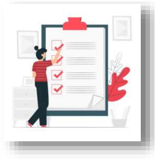
Ilustración 1 Test Burnout

reflexivo, ponemos a tu disposición un cuestionario de autoevaluación; sólo necesitas darle click a la imagen: