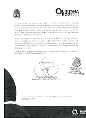
Oficio de invitación al Curso "Los Derechos de las Personas Defensoras de Derechos Humanos"