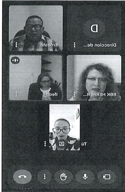
Reunión de trabajo entre la Subsecretaría de Derechos y la Dirección de Capacitación, Formación, Promoción y Difusión en Derechos Humanos de la CDHEQROO