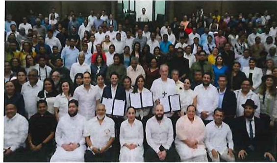
En el municipio de Benito Juárez, se llevó a cabo con la Gobernadora Mara Lezama la Firma del Acuerdo Solidario para la Promoción del Respeto y la Tolerancia Religiosa. 21-febrero-2024