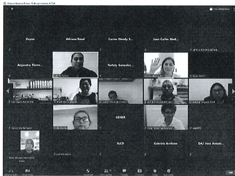
Conferencia virtual "Competencias de los Organismos de Protección de los Derechos Humanos en México"