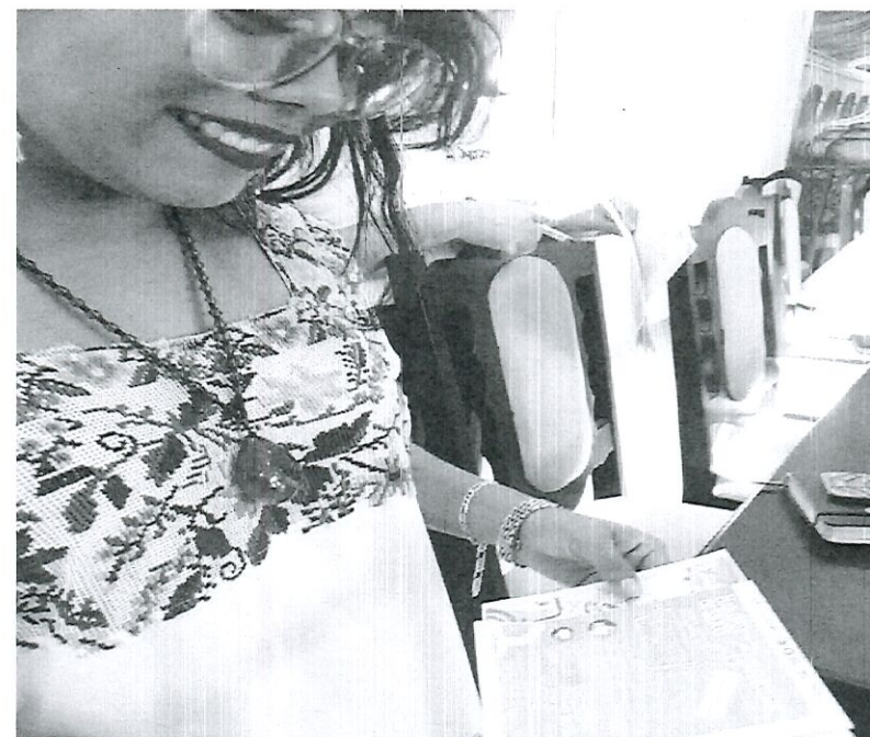
Entrega de volantes en lengua Maya.