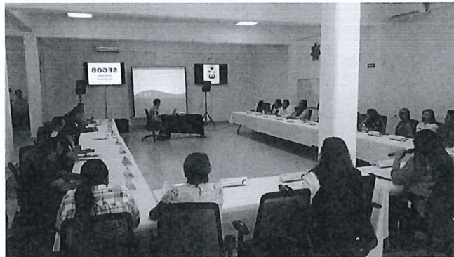
Primera Sesión Ordinaria de la Comisión Interinstitucional al Contra los Delitos en Materia de Trato de Personas del Estado de Quintana Roo.

CRONOGRAMA de trabajo para la actualización de la Ley en Materia de Trato de Personas del Estado de Quintana Roo.