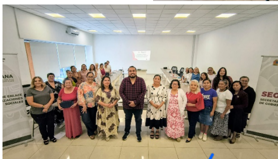
Mesa de trabajo con ministras de culto y la Dirección de Enlace con Organizaciones Sociales, en el municipio de Benito Juárez