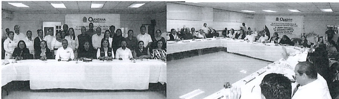
Tercera Sesión Ordinaria del Subcomité Especial de Protección de los Derechos Humanos