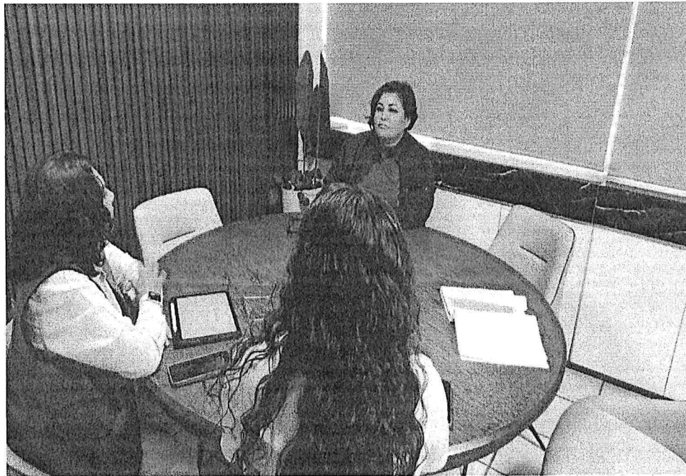
Foto 1: Reunión para la planeación de las capacitaciones de las personas servidoras públicas de la SEGOB en temas de igualdad y no discriminación de las mujeres