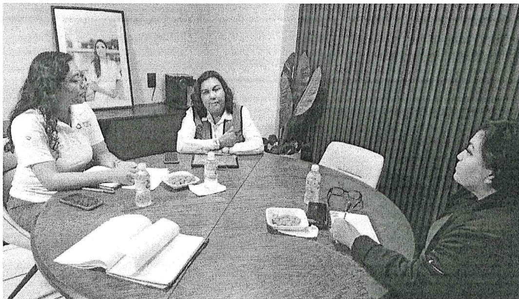
Foto 2: Reunión para la planeación de las capacitaciones de las personas servidoras públicas de la SEGOB en temas de igualdad y no discriminación de las mujeres