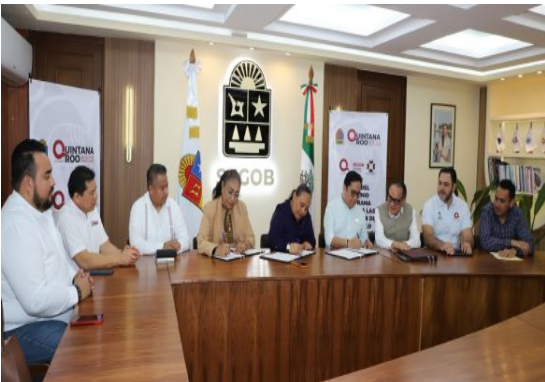
Ciudad de Chetumal, Firma de Convenio.

ATENCIÓN: En esta Ciudad de Chetumal, Quintana roo, a los once días del mes de febrero del año dos mil veintiséis se firmó el Convenio de Coordinación y Cooperación por parte la Secretaría de Gobierno del Estado de Quintana roo, y el Consejo de Notarios del Estado de Quintana roo, Para la formalización Notarial de las asociaciones civiles y agrupaciones de este tipo, a fin de que pudieran beneficiarse del programa. "Fomento a las Actividades de Desarrollo Social".