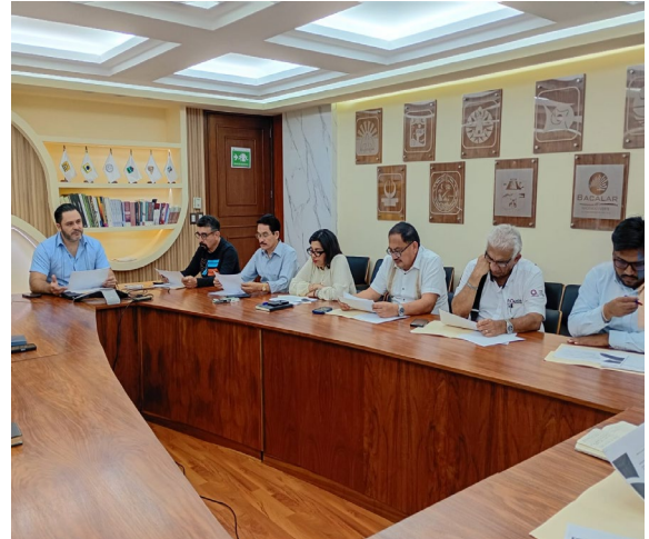
Cd. de Chetumal